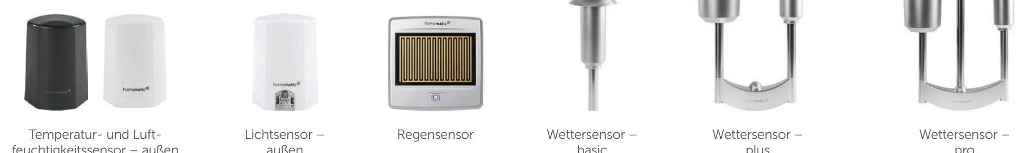
Temperatur- und Luftfeuchtigkeitssensor – außen Lichtsensor – außen Regensensor Wettersensor – basic Wettersensor – plus Wettersensor – pro