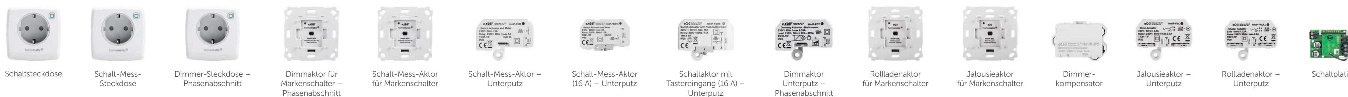
Schaltsteckdose Schalt-Mess-Steckdose Dimmer-Steckdose – Phasenabschnitt Dimmaktor für Markenschalter – Phasenabschnitt Schalt-Mess-Aktor für Markenschalter Schalt-Mess-Aktor – Unterputz Schalt-Mess-Aktor (16 A) – Unterputz Schaltaktor mit Tastereingang (16 A) – Unterputz Dimmaktor Unterputz – Phasenabschnitt Rollladenaktor für Markenschalter Jalousieaktor für Markenschalter Dimmerkompensator Jalousieaktor – Unterputz Rollladenaktor – Unterputz Schaltplatine