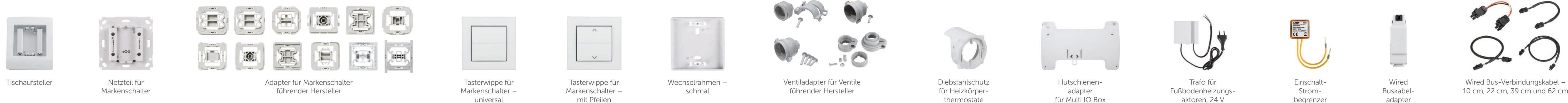
Tischaufsteller Netzteil für Markenschalter Adapter für Markenschalter führender Hersteller Tastenwippe für Markenschalter – universell Tastenwippe für Markenschalter – mit Pfeilen Wechselrahmen – schmal Ventiladapter für Ventile führender Hersteller Diebstahlschutz für Heizkörperthermostate Hutschieneadapter für Multi IO Box Trafo für Fußbodenheizungsaktoren, 24 V Einschaltstrombegrenzer Wired Buskabeladapter Wired Bus-Verbindungskabel – 10 cm, 22 cm, 39 cm und 62 cm