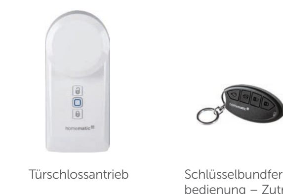
Türschlossantrieb Schlüsselbundfernbedienung – Zutritt