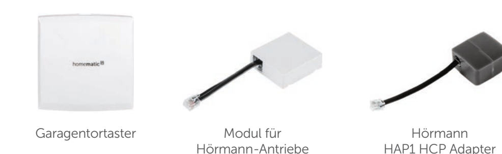
Garagentortaster Modul für Hörmann-Antriebe Hörmann HAP1 HCP Adapter