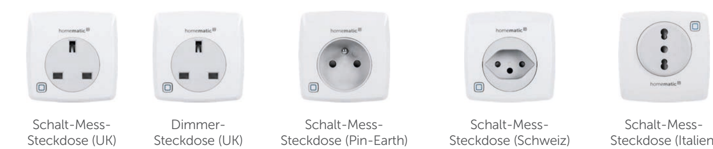
Schalt-Mess-Steckdose (UK) Dimmer-Steckdose (UK) Schalt-Mess-Steckdose (Pin-Earth) Schalt-Mess-Steckdose (Schweiz) Schalt-Mess-Steckdose (Italien)