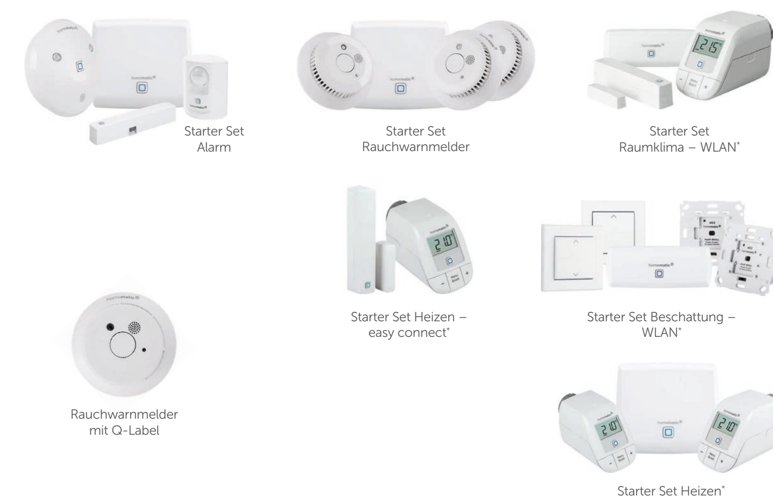
Starter Set Alarm Starter Set Rauchwarnmelder Starter Set Raumklima – WLAN Starter Set Heizen – easy connect Starter Set Beschattung – WLAN Starter Set Heizen