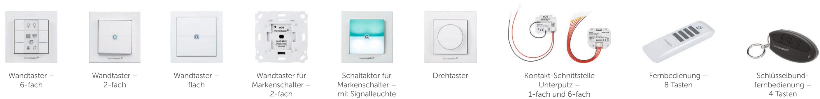
Wandtaster – 6-fach Wandtaster – 2-fach Wandtaster – flach Wandtaster für Markenschalter – 2-fach Schaltaktor für Markenschalter – mit Signalleuchte Drehtaster Kontakt-Schnittstelle Unterputz – 1-fach und 6-fach Fernbedienung – 8 Tasten Schlüsselbundfernbedienung – 4 Tasten