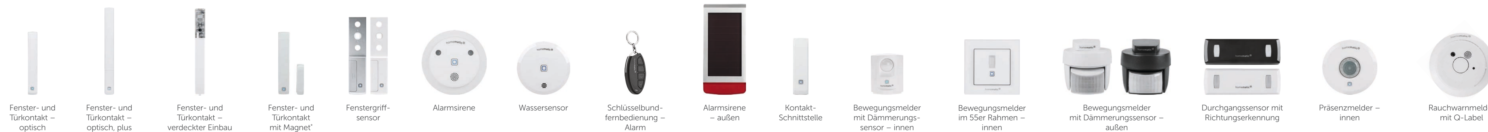
Fenster- und Türkontakt – optisch Fenster- und Türkontakt – optisch, plus Fenster- und Türkontakt – verdeckter Einbau Fenster- und Türkontakt mit Magnet Fenstergriff-sensor Alarmsirene Wassersensor Schlüsselbundfernbedienung – Alarm Alarmsirene – außen Kontakt-Schnittstelle Bewegungsmelder mit Dämmerungssensor – innen Bewegungsmelder im 55er Rahmen – innen Bewegungsmelder mit Dämmerungssensor – außen Durchgangssensor mit Richtungserkennung Präsenzmelder – innen Rauchwarnmelder mit Q-Label