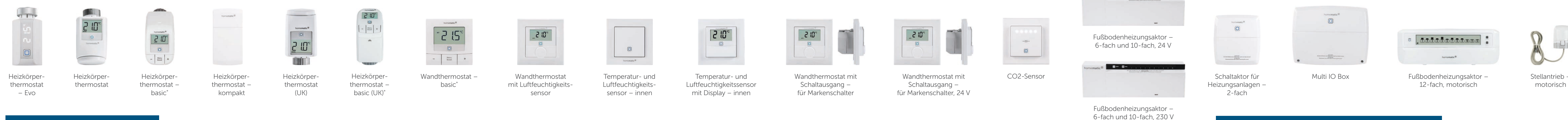
Heizkörperthermostat – Evo Heizkörperthermostat Heizkörperthermostat – basic Heizkörperthermostat – kompakt Heizkörperthermostat (UK) Heizkörperthermostat – basic (UK) Wandthermostat – basic Wandthermostat mit Luftfeuchtigkeitssensor Temperatur- und Luftfeuchtigkeitssensor – innen Temperatur- und Luftfeuchtigkeitssensor mit Display – innen Wandthermostat mit Schaltausgang – für Markenschalter Wandthermostat mit Schaltausgang – für Markenschalter, 24 V CO2-Sensor Fußbodenheizungsaktor – 6-fach und 10-fach, 24 V Multi IO Box Fußbodenheizungsaktor – 12-fach, motorisch Stellantrieb – motorisch