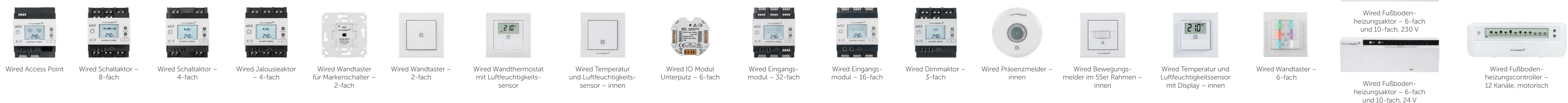
Wired Access Point Wired Schaltaktor – 8-fach Wired Schaltaktor – 4-fach Wired Jalousieaktor – 4-fach Wired Wandtaster für Markenschalter – 2-fach Wired Wandtaster – 2-fach Wired Wandthermostat mit Luftfeuchtigkeitssensor Wired Temperatur und Luftfeuchtigkeitssensor – innen Wired IO Modul Unterputz – 6-fach Wired Eingangsmodul – 32-fach Wired Eingangsmodul – 16-fach Wired Dimmaktor – 3-fach Wired Präsenzmelder – innen Wired Bewegungsmelder im 55er Rahmen – innen Wired Temperatur und Luftfeuchtigkeitssensor mit Display – innen Wired Wandtaster – 6-fach Wired Fußbodenheizungsaktor – 6-fach und 10-fach, 230 V Wired Fußbodenheizungsaktor – 12 Kanäle, motorisch