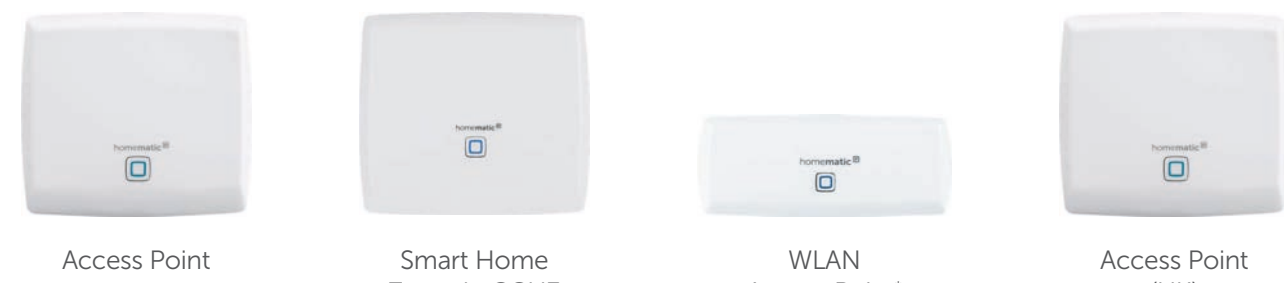
Access Point Smart Home Zentrale CCU3 WLAN Access Point Access Point (UK)